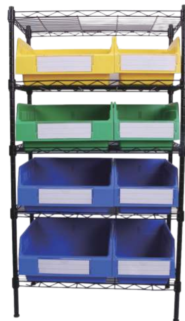
■ 配合钢丝料架使用