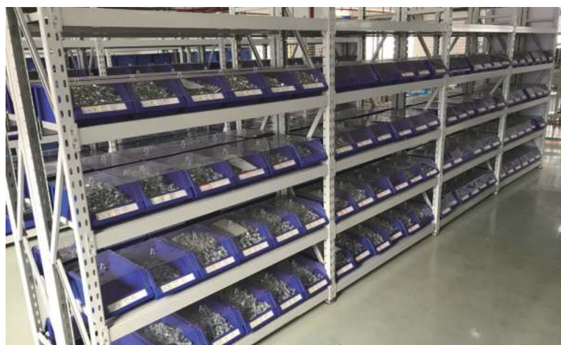
■ 配合层板货架使用