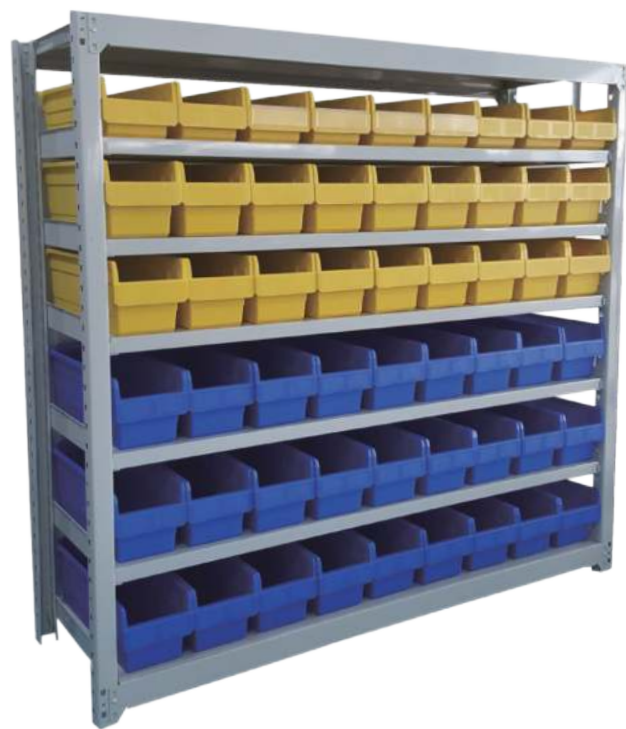
■ 配合层板货架使用